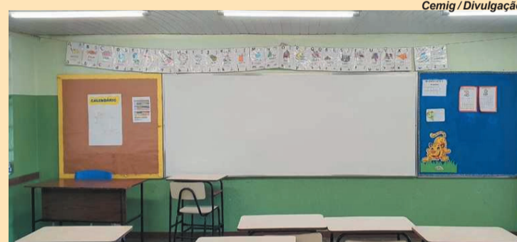
Nova iluminação proporcionará mais conforto aos alunos da rede estadual de ensino

Iniciativa Cemig nas Escolas trocou, no último ano, mais de 200 mil lâmpadas ineficientes em todo o estado